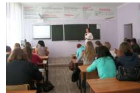
открытый урок по математике