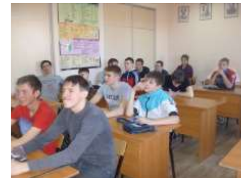
турнир Удивительное электричество